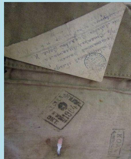
Письмо с фронта, 1942 год