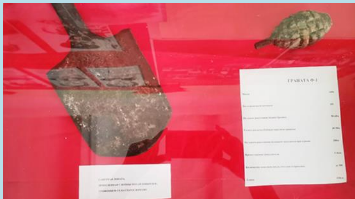
Саперная лопата и граната Ф1