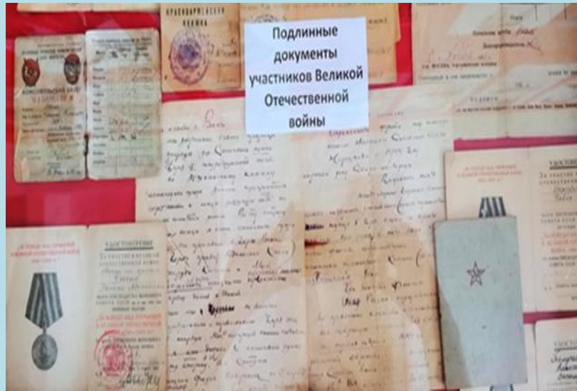
Подлинные документы участников Великой Отечественной войны уникальны для нашего музея