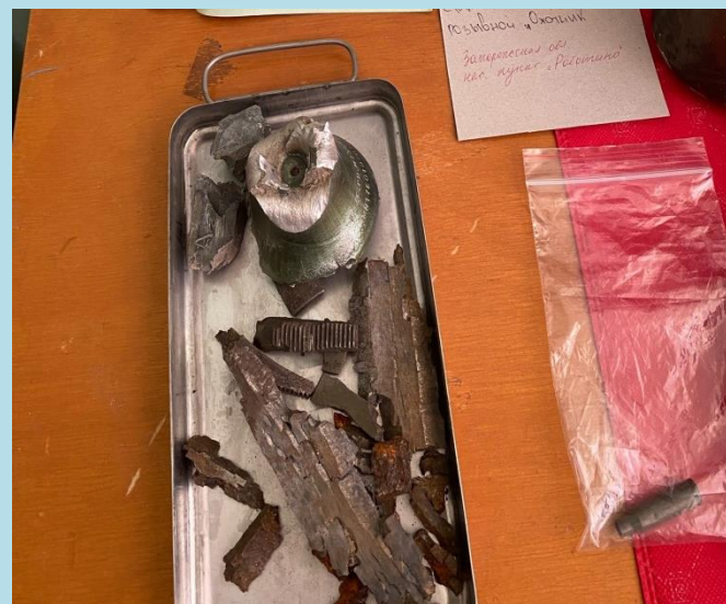
Осколки натовского оружия